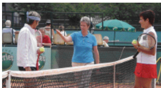
Mise en pratique à l'occasion des championnats de France individuels.

Les candidats retenus pour cette phase régionale sont ensuite regroupés, sensibilisés et préparés par la CRA en vue de la sélection régionale. Lors de la phase